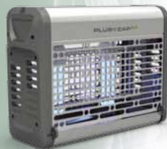
PlusZapEco 40W RVS