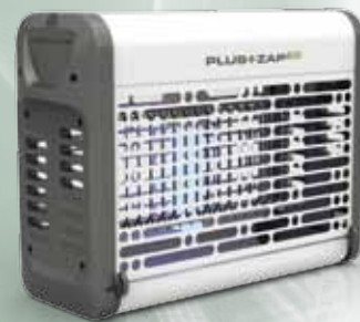
PlusZapEco 20W wit

Twee jaar garantie (Met uitzondering van UV buis en starter)